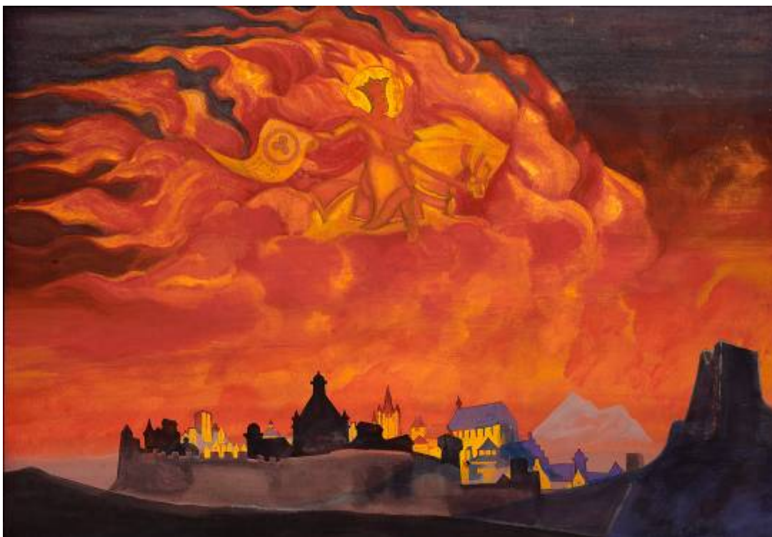
«София Премудрость». Н.К.Рерих

На картине Н.К.Рериха "Звенигород" символически оповещено о строительстве Нового города – мудрые старцы выносят из Храма макет города будущего. Прообразом строительства на Алтае явилось основание в 1930 г. талантливым сибирским писателем Г.Д.Гребенщиковым в далёкой Америке Свято-Сергиева скита. Архитектура Храма на картине полностью повторяет архитектуру часовни, построенной Гребенщиковым в Америке по проекту Н.К.Рериха.