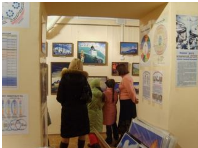
Детям о Святом Сергии.