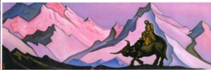
«Конфуций Справедливый», «Лао Цзы»

Конфуций и Лао Цзы – Великие Учителя, жившие в Китае в VI-V веках до н.э.