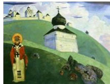
«Пантелеймон-целитель», «Святой Никола»

На фоне красочного русского пейзажа изображены христианские святые Пантелеймон-целитель, Святой Никола.