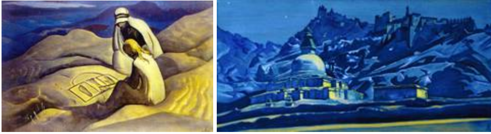
«Знаки Христа», «Перекрёсток путей Христа и Будды»

Все народы во все времена стремились познать Истину. Истина для народов Земли едина, хотя облекается в разные формы, описывается разными словами, близкими к сознанию определённых народов, рас и других групп людей. Высокие духи, Подвижники всех народов всегда искали эту Истину. Так и один из Величайших Посвящённых, воплотившийся на Земле, – Иисус Христос, также искал эту Истину и долгие годы учился в тех местах, где находятся основы этой Истины. Такие места – это древние монастыри Тибета и Индии.