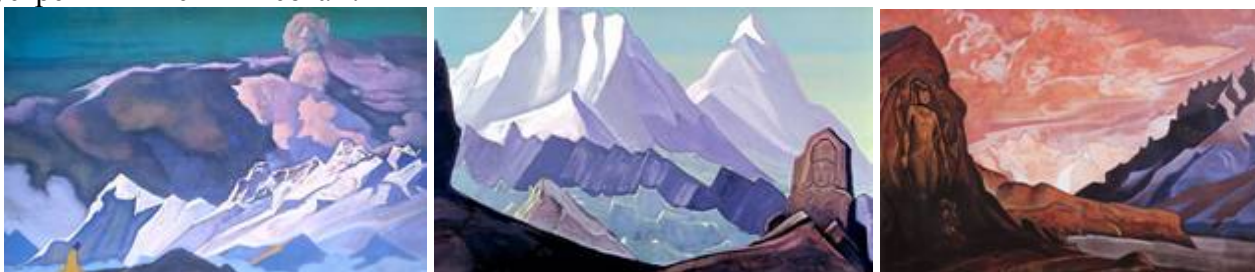
«Калки Аватар», «Майтрейя», «Майтрейя – Победитель»

Отшельники сюгэндо, или «укрывающиеся в горах», являлись братством странствующих монахов, горных воинов и аскетов. У них практиковалась «школа природного знания», которая учила постижению Знания в первозданном окружении. Йено-Гуйо Дья помогает всем заблудившимся и сбившимся с пути. Он – друг вставших на путь просветления и устремившихся к высотам.