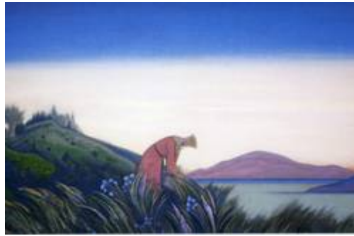
«Добрые травы. Василиса Премудрая»

На картине изображено прибытие Рюрика на Русь. Оживает старина в блеске ослепительных, жизнерадостных, бодрых красок. Всё полно внутренней силы, красоты, всё «Русью пахнет».