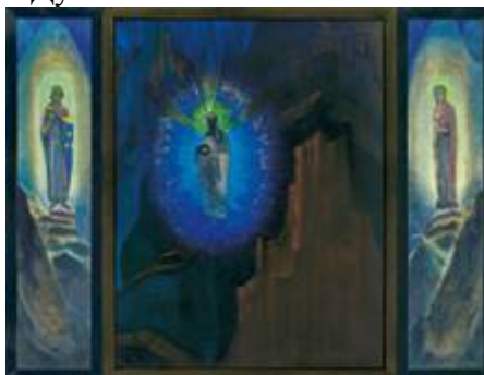
«Fiat Rex! Да здравствует Король!»

На картине Великий Учитель достиг определенной высоты Духа. Но там, за Ним тьма, которую нужно преодолеть. Он окружен ореолом Света, являясь источником этого Света и освещая дорогу идущим за Ним. Те же, Кто идет за Ним, освещают путь следующим. Свет – это Знание, Путь и Любовь. Все идущие по пути Света объединяются в Великое единое Целое, ведущее к беспредельным высотам Духа.