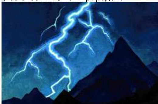
«Зов Неба. Молния»

Сейчас идёт разделение на Добро и зло. Но вначале разделение происходит внутри каждого человека. Именно это зло надо уничтожить, преобразовав отрицательные свойства в положительные качества, которые способствуют духовному совершенствованию. На картине светлый воин Арджуна – ученик Кришны, герой «Бхагаватгиты», входящей в индийский эпос «Махабхарата», вступил в битву со своей низшей природой.