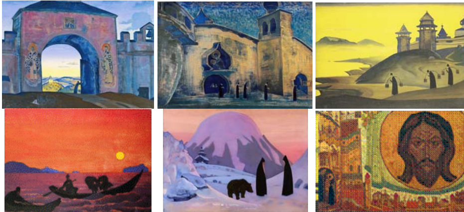
Серия «Sancta»: «И мы открываем врата», «И мы несём Свет», «И мы трудимся», «И мы ведём лов», «И мы не боимся», «И мы видим»

На картине с вершины звонницы с колоколом открывается вид на город с золотыми куполами храмов и белокаменными стенами на фоне полноводных русских рек и холмов. Может быть, так представлялся Мастеру Город Будущего. В 1943 году Н.К. Рерих повторяет картину «Земля Славянская». В годы войны Он знает: непобедим дух русский, непобедима земля Славянская.