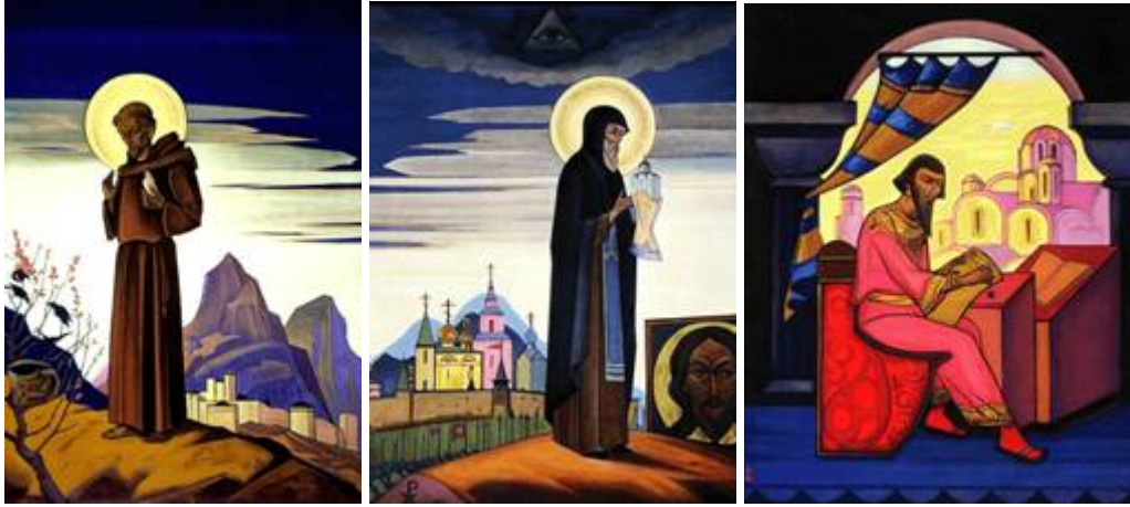
«Святой Сергий Радонежский», «Святой Франциск», «Ярослав Мудрый»