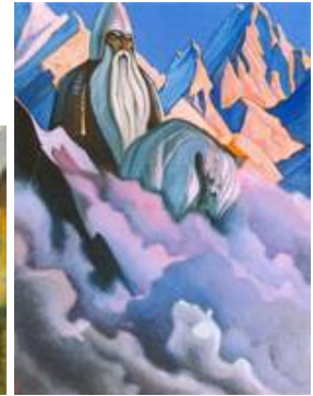
«Волоком волокут», «Наши предки», «Святогор»

Свет Новой Страны виднеется и в каждодневном тяжком труде простых неизвестных тружеников.