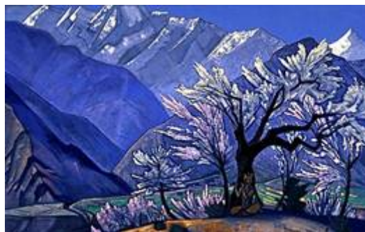
«Весна в Кулу. Кришна»

Во время странствий по Востоку Иисус проходил по тем же местам, где бывал другой Великий Космический Учитель – Будда. На картине «Перекрёсток путей Христа и Будды» изображено место, где пересеклись пути двух Великих Учителей. Здесь сооружена ступа, указывающая на это событие. Это и конкретное место, и перекрёсток духовный, где пересеклись Учения двух Великих Учителей, каждое из которых является продолжением и дополнением другого. Н.К.Рерих писал: «...Учения Христа и Будды, в которых так ясно выражена светлая идея Общины, сводят все народы в одну семью... И община земная так легко и научно вливается в великую Общину всех Миров».