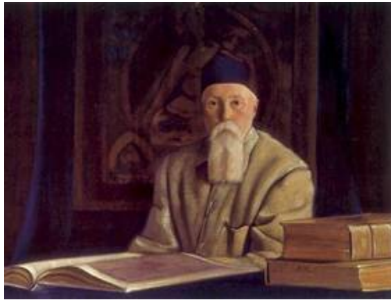
С.Н. Рерих. Академик Н.К.Рерих. 1937.