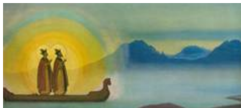
«Борис и Глеб»

Олицетворением духовных высот являются горы, которые манят к своим вершинам пастушка на картине «Наши предки». На вершинах живут русские богатыри, которые стоят на дозоре и охраняют границы от врагов. Богатырь Святогор – символ силы и мощи русского народа.