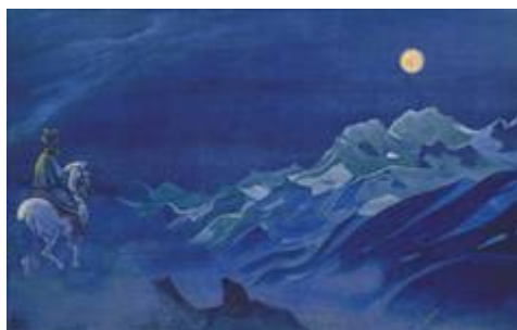
«Ойрот – вестник Белого Бурхана»

В поисках Истины Зороастр удалился на гору. Там на него с небес обрушилось великое пламя. Учитель вышел из него невредимым, получив Божественное Озарение. В руках у Него – Чаша подвига с пылающим Сокровищем. Сокровище Чаши необходимо пронести, сберечь и приумножить.