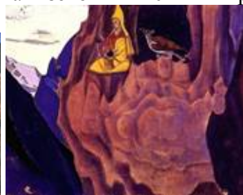
«Указ Учителя», «Весть орла»

Согласно Космическим Законам, человечество самостоятельно строит свою жизнь, следуя выбранному пути. Великие Учителя делают всё возможное, чтобы указать наиболее верный путь. Действуя в тонких мирах, Они всеми возможными способами посылают вести, указания, знаки.