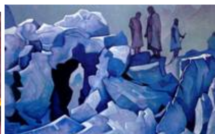
«Страж входа», «Дозор Гималаев»

Много отважных искателей отправляется на поиск Истины. Но не просто найти этот путь. Многие наши современники пытаются это сделать. Существуют архивные документы, подтверждающие факты того, что правительства многих стран отправляли экспедиции на поиски мест обитания Великих Учителей человечества. В том числе Сталин и Гитлер. Но даже при использовании новейшей современной техники таким способом найти эти места никому не удалось.